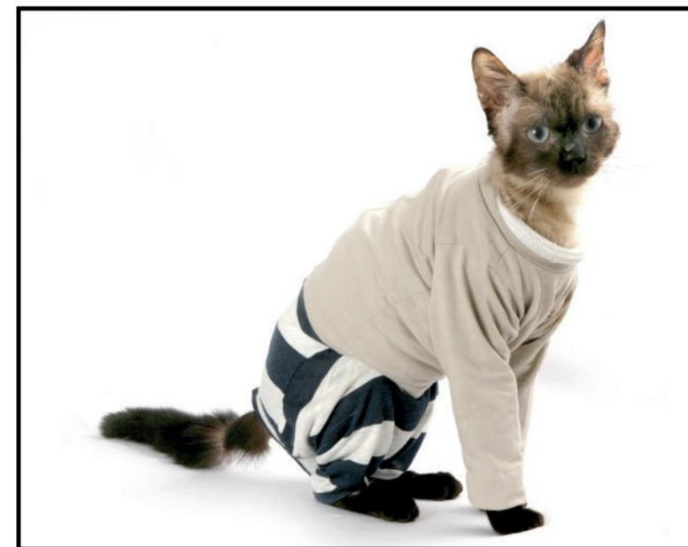
Figure 3. Treatment using padded clothing in a 3-year-old male cat.