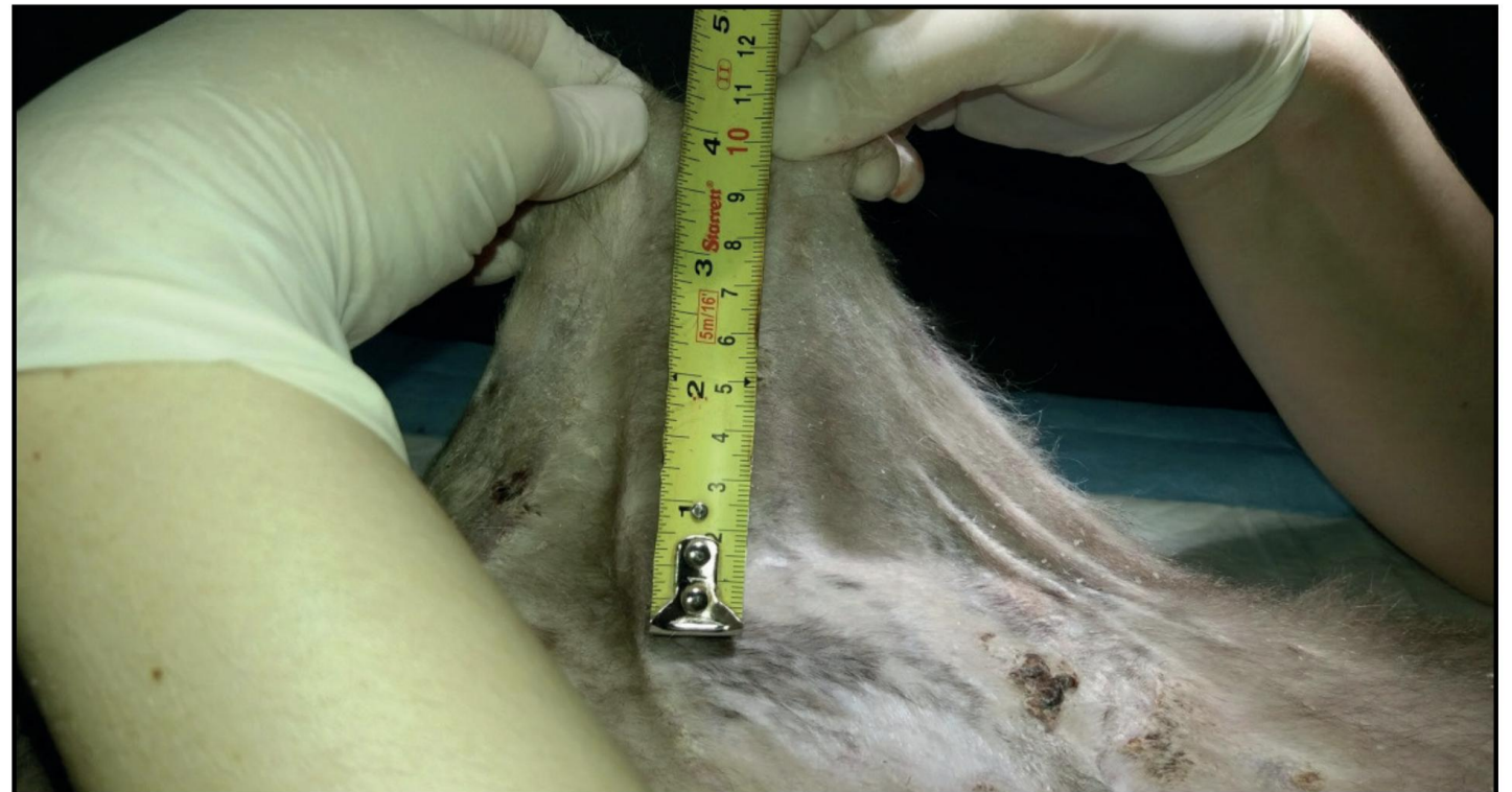
Figure 2. The value of a vertical measurement (11 cm) was obtained from the fold at the level of the lumbar dorsum of a 3-year-old male castrated, no defined short hair race cat.

A.C.S. Andrade, L.M.R. Rey, I.C. Santos, et al. 2021. Cutaneous Asthenia in a Domestic Cat ( Felis silvestris catus ). Acta Scientiae Veterinariae . 49(Suppl 1): 690.